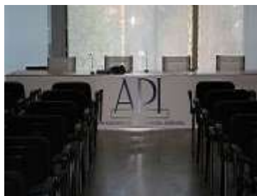
BAVENO - SS Sempione Km 87 vco@apimpresa.it

Associazione Piccole e Medie Industrie delle Province di Novara, V.C.O. e Vercelli