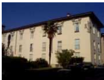
NOVARA - Via Aldo Moro 1 segreteria@apimpresa.it