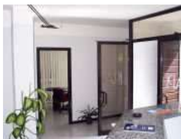
BORGOMANERO - Viale Marconi 115 borgomanero.info@apimpresa.it