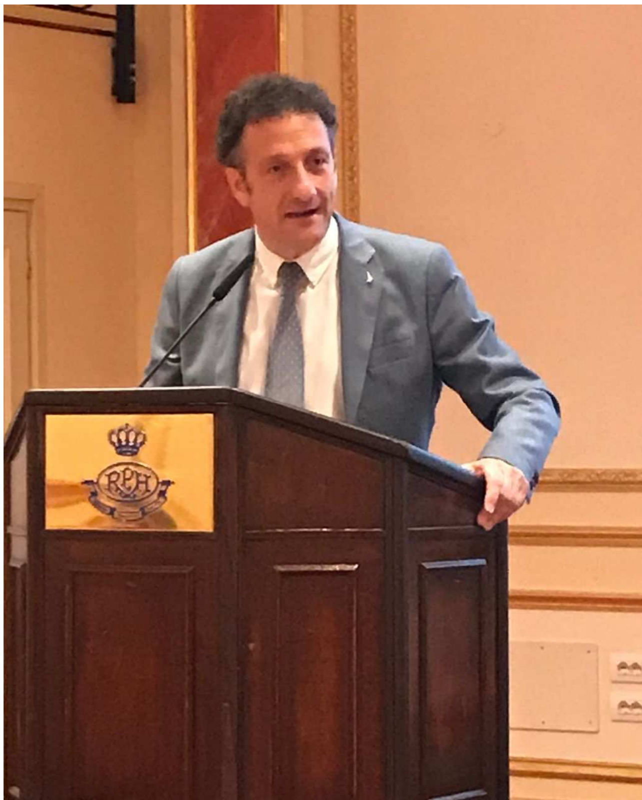
Vice Presidente della Commissione Finanze della Camera dei Deputati Alberto Gusmeroli