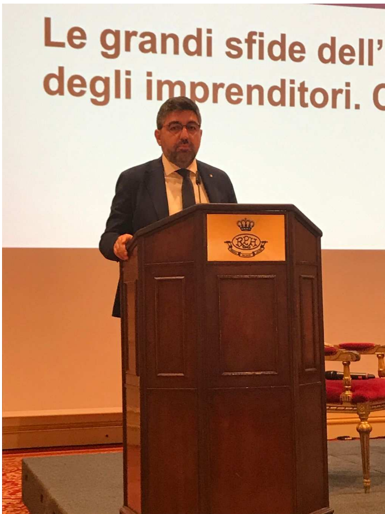
Consigliere Regionale Federico Perugini