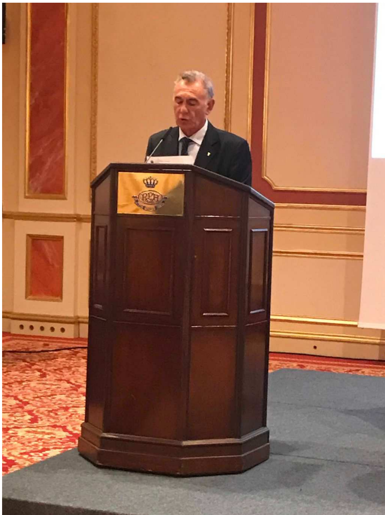
Presidente Provincia di Verbania Arturo Lincio