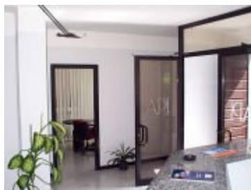
BORGOMANERO - Viale Marconi 115 borgomanero.info@apimpresa.it