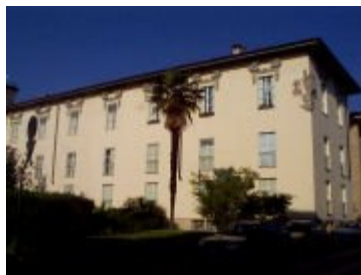
NOVARA - Via Aldo Moro 1 segreteria@apimpresa.it