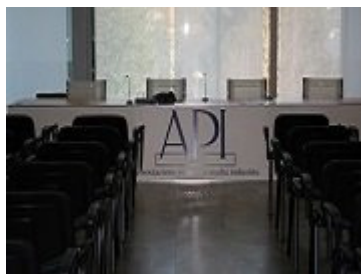
BAVENO - SS Sempione Km 87 vco@apimpresa.it

Associazione Piccole e Medie Industrie delle Province di Novara, V.C.O. e Vercelli